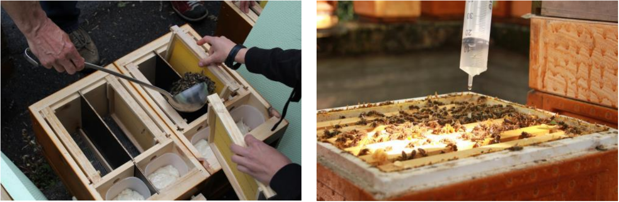
Abb. 2: Oben links: Fütterung eines Kunstschwarms mit Lithiumchlorid im Ikea-Papierkorb; oben rechts: Einschlagen der mit LiCl behandelten Kuntschwärme; unten links: Erstellen von Mini-Plus Völkchen; unten rechts: Beträufeln eines Mini-Plus-Volks mit LiCl.